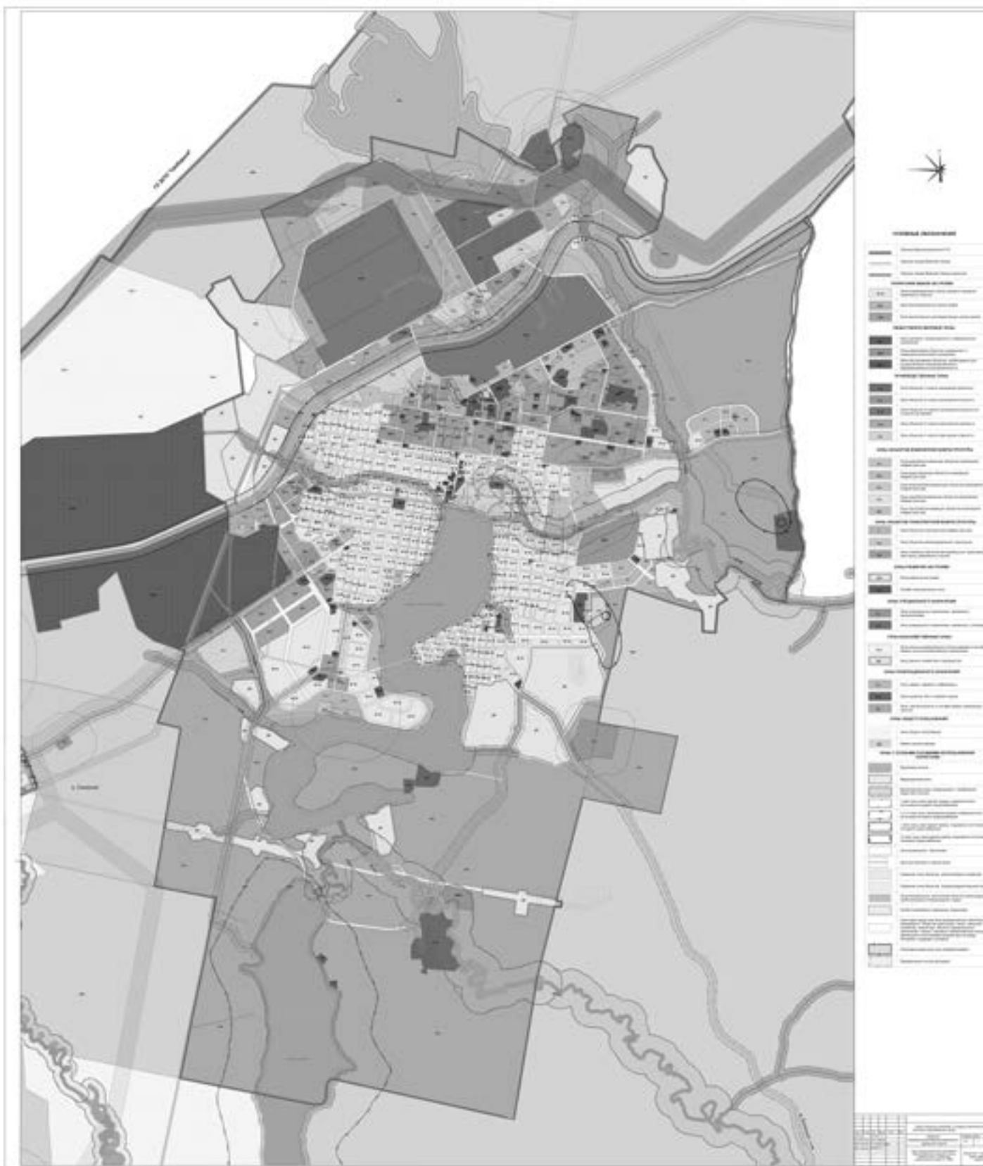
Данные приложения в высоком разрешении опубликованы на официальном сайте администрации Верхнесалдинского городского округа: http://v-salda.ru/